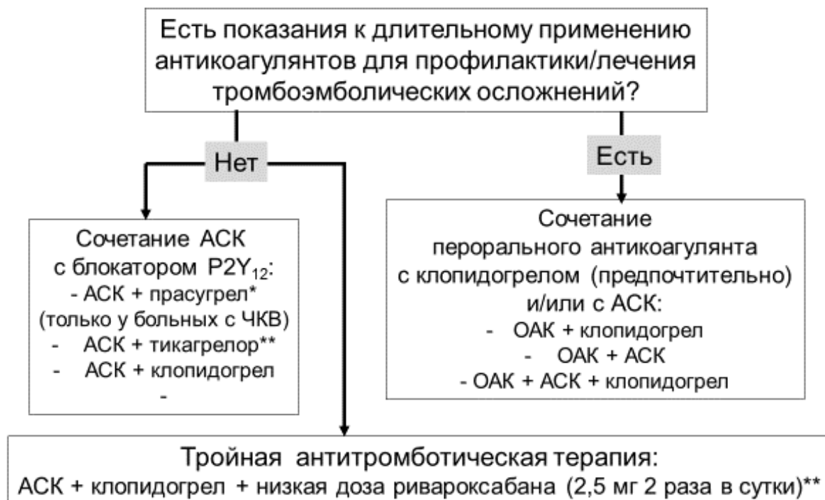
Рисунок 1. Выбор анти тромботических средств при ИМпСТ