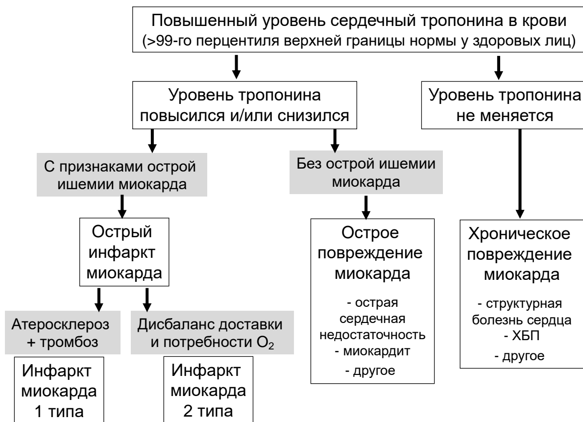
Рисунок 2. Диагностика и дифференциальная диагностика острого инфаркта миокарда 1 и 2 типов.

Для биохимической диагностики острого ИМ должны использоваться методы определения концентрации сердечного тропонина в крови, обеспечивающие коэффициент вариации определений 99-го перцентиля верхней референсной границы не выше 20% (оптимально — не выше 10%).