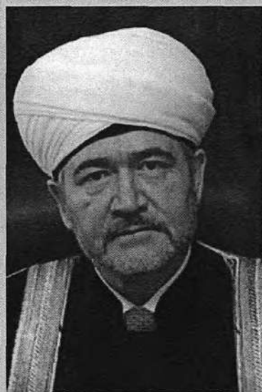
Муфтий шейх Равиль Гайнутдин