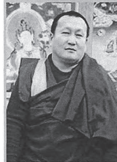
Дамба Бадмаевич Аюшеев

Глава Буддийской традиционной Сангхи России